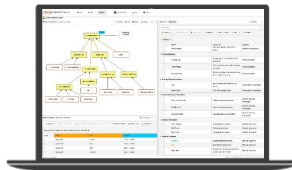
PENCIL Decision Modelerの画面